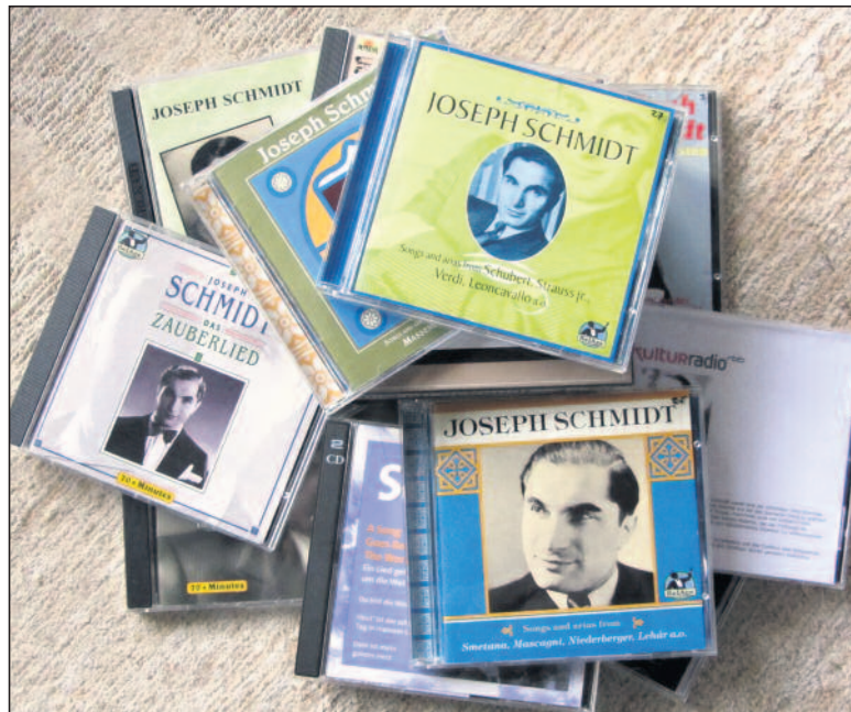
Die Stimme Schmidts ist auf einer reichen CD-Auswahl zu hören.

Die neu herausgegebene Biografie aus dem Römerhof Verlag Zürich kann im Buchhandel oder beim Autor bezogen werden. Alfred A. Fassbind: Joseph Schmidt – Sein Lied ging um die Welt, 336 Seiten, 44 Franken, ISBN 978-3-905894-14-1, mit zahlreichen Abbildungen und CD. (Kontakt: alfredfassbind@hispeed.ch oder Telefon 055 240 33 35.)